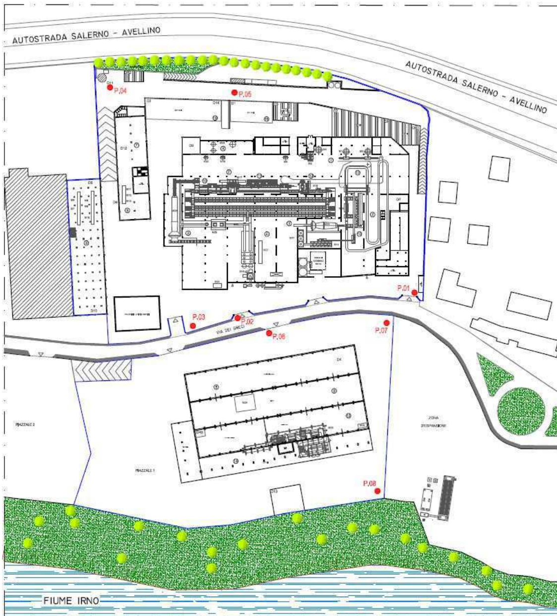
Figura 3 - Estratto planimetria con punti di misura fonometrici

Dopo ogni campagna di misura sarà prodotta una mappa delle isofoniche, questo anche al fine di dare evidenza delle numerose sorgenti antropiche esterne alle Fonderie Pisano (strade, industrie, etc..).