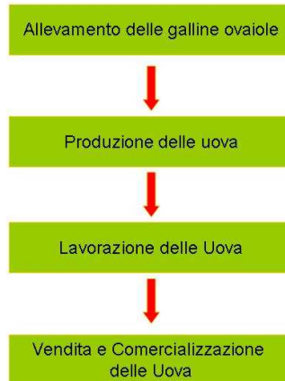
Figura B.1 Schema di flusso dell'intero ciclo