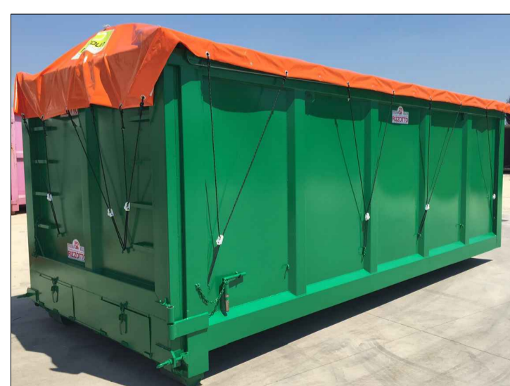
Cassone con telo di copertura